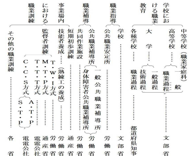
図1 職業訓練行政の体系(職業指導を含む)

訓練の体系」では上の構想をさらに明確に「学校における職業教育」を含めて図1のように整理した。職業訓練の学校制度との関連は、ILOの定義のように、学校における様々な学習活動を職業訓練の一部としている。ただ、GHQ語には無い学校等を対象に包含していたが、徒弟制度は除外していた特徴がある。